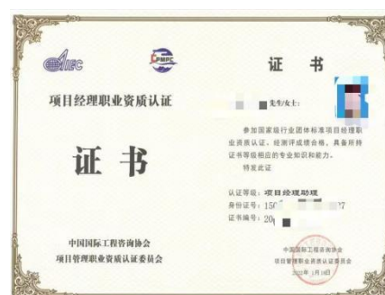
项目经理助理证书式样