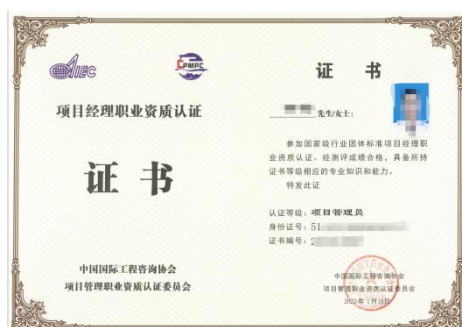
项目管理员证书式样

能力证书考试每年 4 次（3、6、9、12 月），通过中国国际工程咨询协会项目管理四川资质认证中心官网线上报名（学生自愿报名参加，证书费用 6800 元/生，由协会认证中心另行收取）